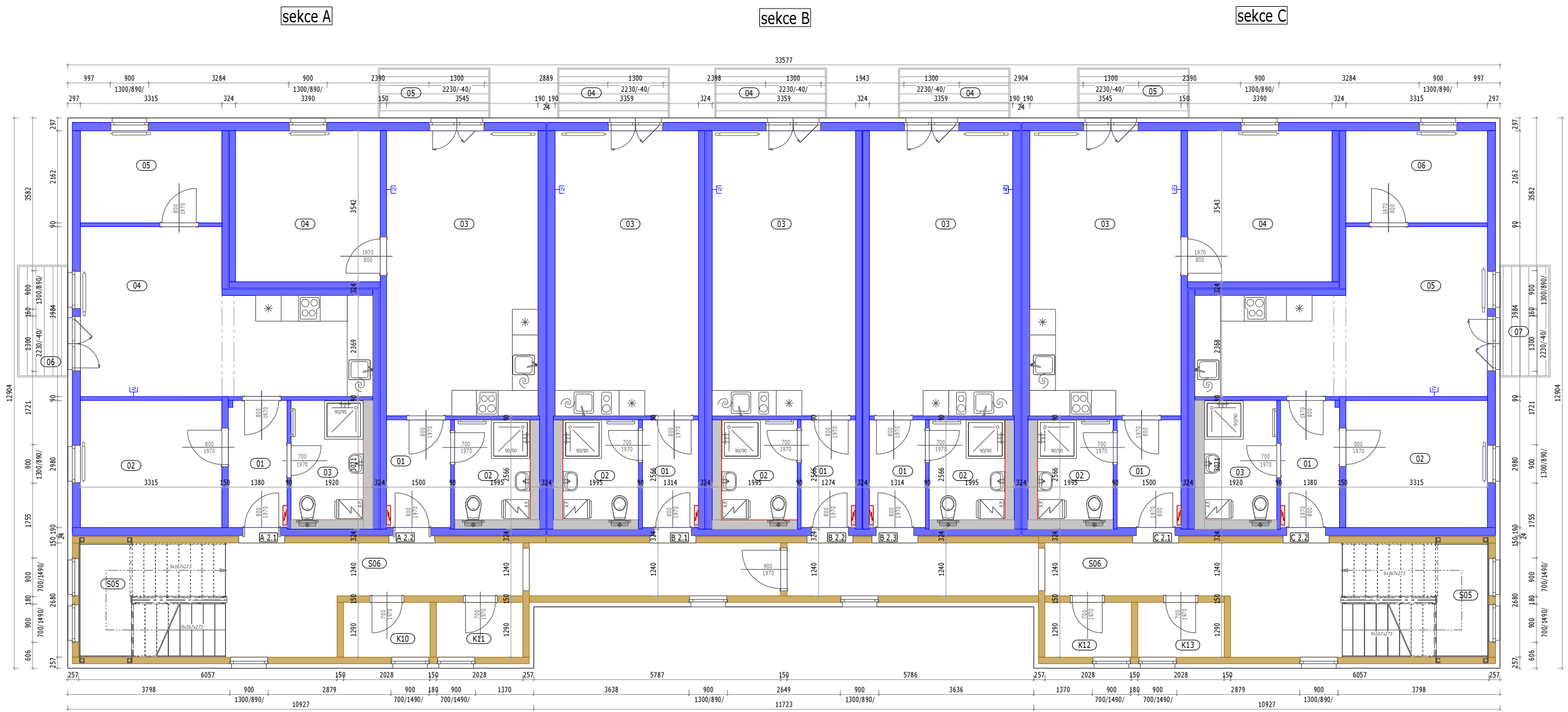
LEGENDA MÍSTNOSTI 2NP (SEKCE - A, S1, B, S2, C)