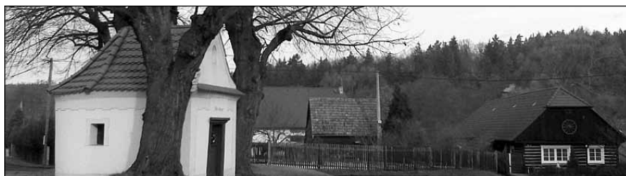
pohled na kapličku v obci Kornatice