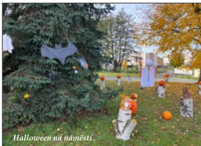
Halloween na náměstí