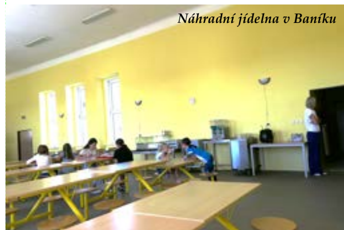
Náhradní jídelna v Baníku