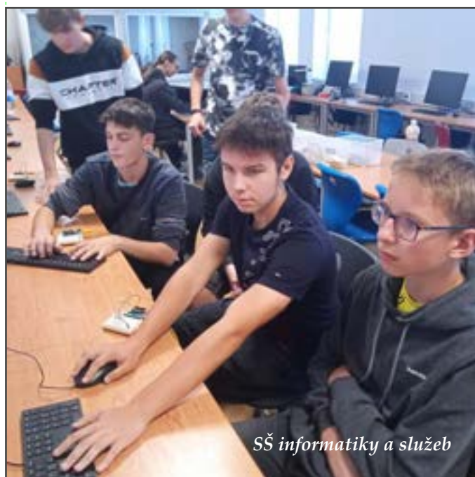
SŠ informatiky a služeb

Tým ZŠ Zbůch vám přeje pohodové prožití vánočních svátků a hodně zdraví a štěstí v novém roce.