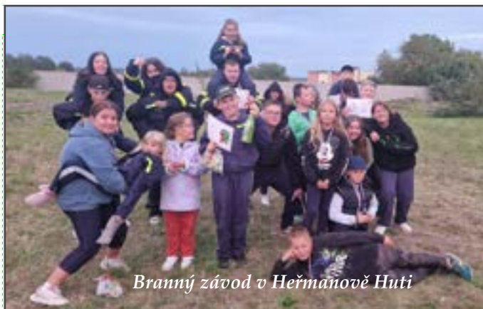
Branný závod v Heřmanově Huti

Na tomto zásahu, který trval bezmála 22 hodin, bylo kromě naší jednotky požární ochrany aktivováno také družstvo civilní ochrany, které zajišťovalo stravu pro zasahující hasiče ostatních sborů.