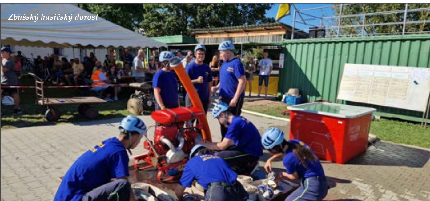
Zbůšský hasičský dorost

Alena Nezhybová a Ing. Josef Šlauf ml.