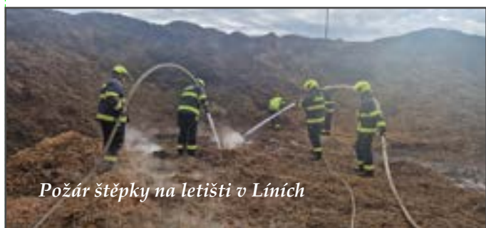
Požár štěpky na letišti v Líních

K likvidaci požáru bylo nutné vyhlásit 2. stupeň požárního poplachu a ke konečnému dohašení došlo až krátce před třetí hodinou ranní následujícího dne.