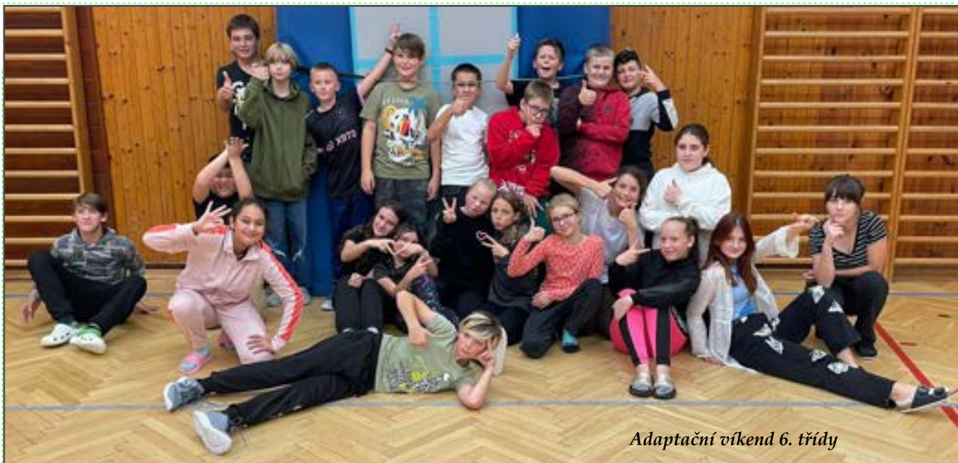
Adaptační víkend 6. třídy

a rovnováhu podpořily na trampolínách, prolézačkách a skluzavkách.