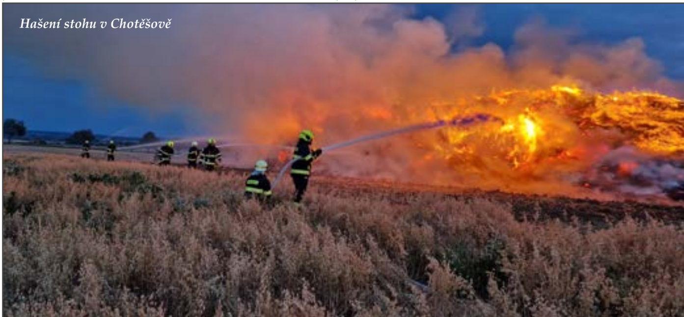
Hašení stohu v Chotěšově

Zbůšští dobrovolní hasiči společně s obcí a řadou místních spolků zabezpečovali 2. září úspěšné oslavy 770 let naší obce. V lednu se ale budeme muset obejít bez oblíbeného Hasičského bálu.