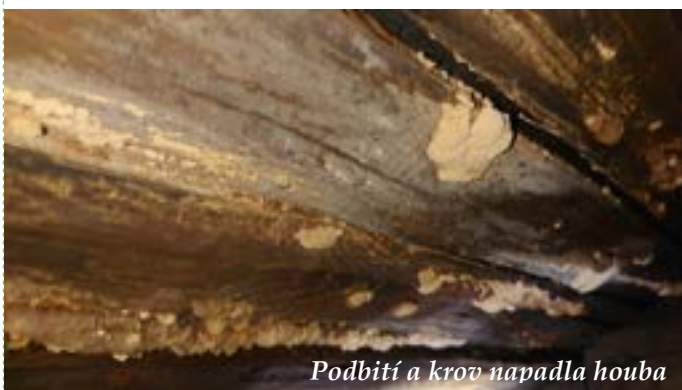
Podbití a krov napadla houba

Koncem léta jsme museli z bezpečnostních důvodů uzavřít školní jídelnu. Nad střední částí, kde děti jedly, byla narušena konstrukce střechy a žákům hrozilo nebezpečí úrazu. Kvůli dlouhodobé špatné cirkulaci vzduchu napadla původní vazníky a trámy dřevokazná houba.