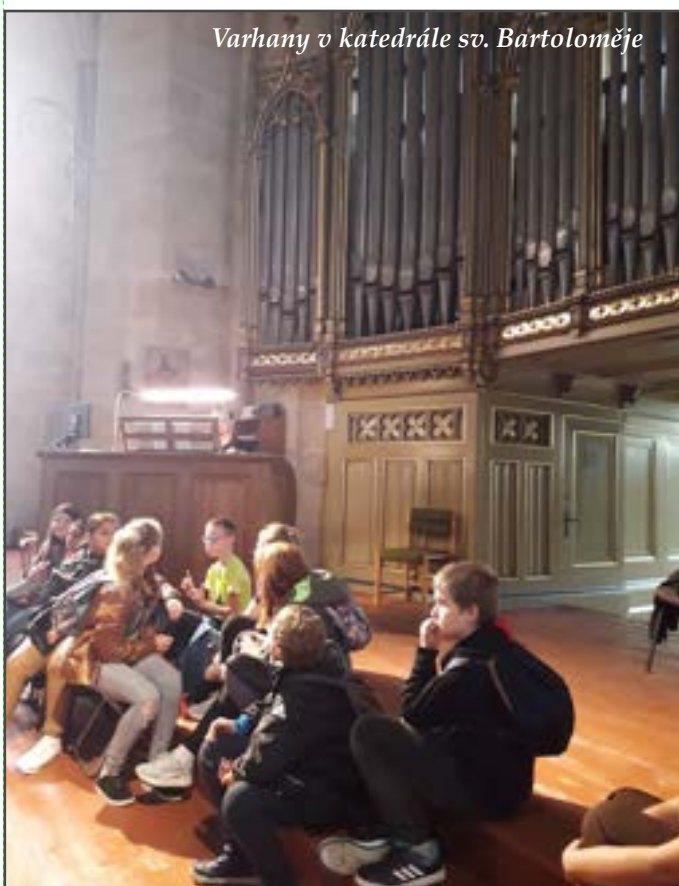
Varhany v katedrále sv. Bartoloměje

Akce přináší inspirující zážitky, podporují kreativitu, týmovou práci a zdravý životní styl. Napomáhají také k navazování přátelských vazeb a utužování kolektivu.