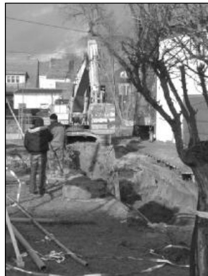
Foto z výstavby kanalizace