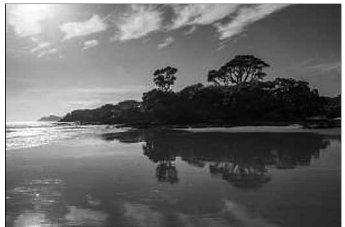
Krajina na Novém Zélandu

Komunita přežila veškeré obtíže a začala se ohlížet po všech možných způsobech, jak si vydělat peníze. Jedním z významných zdrojů příjmů byl prodej dřevěných šindelů. Ty vyráběli muži, vysekávali je do správného rozměru, ženy je pak svazovaly po sto kusech a táhly po skluzavce dolů k řece, kde se nakládaly na pramici a odvážely k ústí řeky do moře. Tam šindele čekaly, dokud nepříplula loď a neodvezla je po moři do Aucklandu. Jenže místní nikdy nevěděli, kdy to bude, a tak hromady šindelů museli každý den kontrolovat, dokud loď nepřípluje. Jakmile je naložili a loď s nákladem odplula, musel se někdo z vesnice rychle vydat pěšky po třicetmilové cestě do Aucklandu a doufat, že do přístavu dorazí dřív než náklad šindelů. Hrozilo totiž, že šindele ukořistí a prodá někdo cizí. Zpočátku dostávala vesnice za šindele velice málo peněz, ale s koncem války o půdu a s objevením zlata na poloostrově Coromandel začala stoupat poptávka po stavebních materiálech, ceny